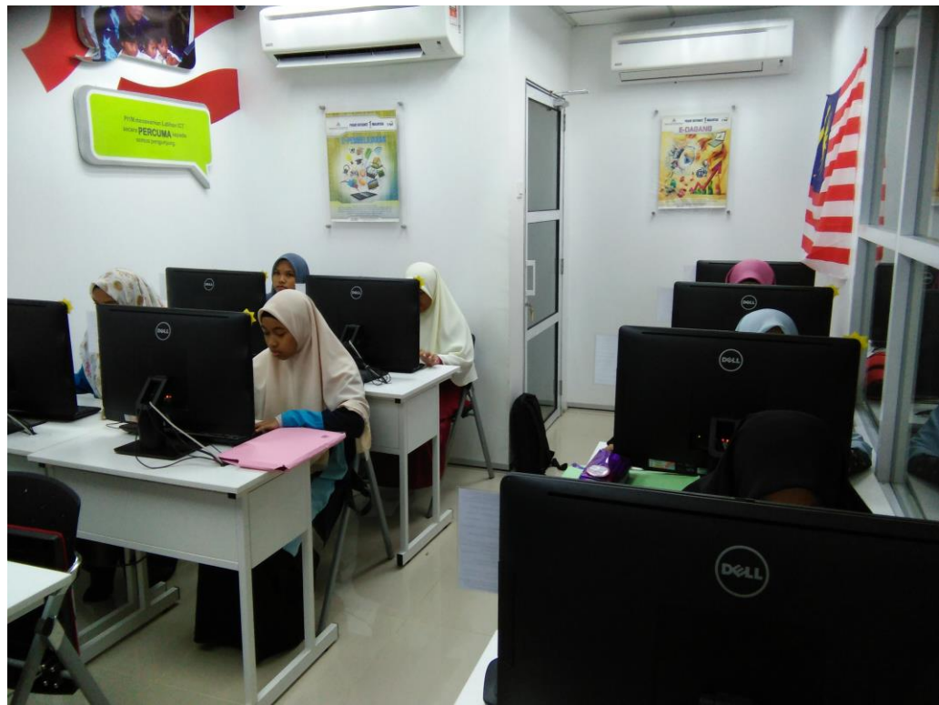
Peserta sedang menyiapkan latihan