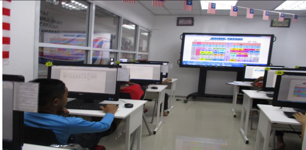
Peserta sedang tekun membuat jadual kelas