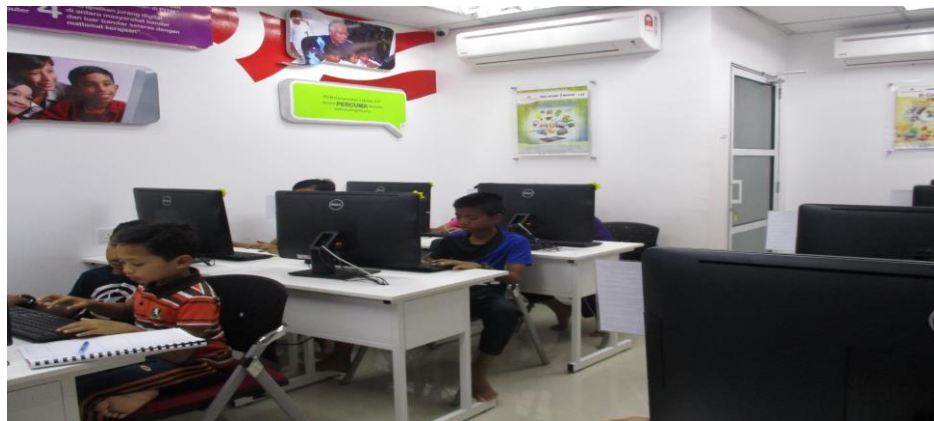
Antara peserta yang hadir untuk mengikuti latihan yang telah diberikan oleh petugas PI1M.