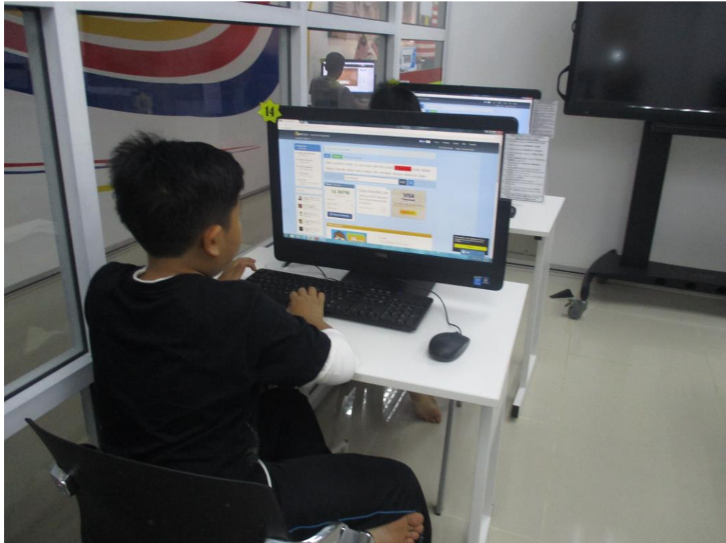
Peserta sedang membuat latihan E-Pembelajaran "Menaip Pantas"