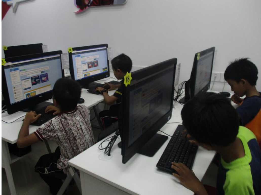
Peserta sedang melakukan latihan E-Pembelajaran "Menaip Pantas"